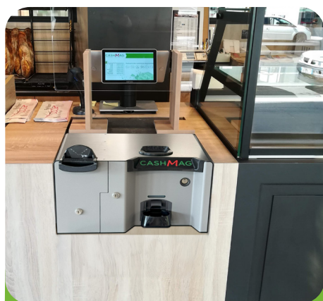
Prêt à poser