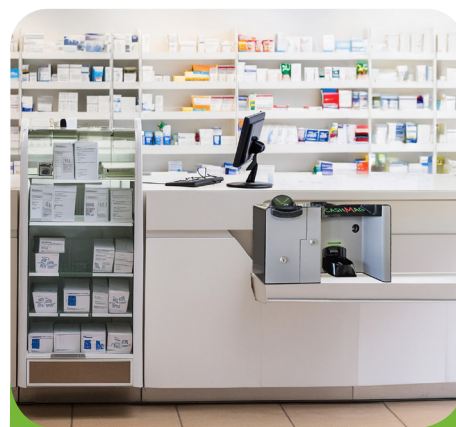
Discret sur votre comptoir